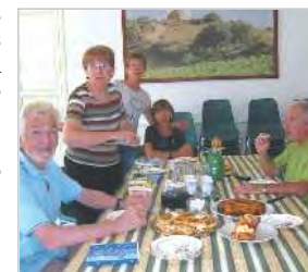
Après l'effort le réconfort.

Après une longue décroissance, notre Commune retrouve une taille comparable à celle des années 70.