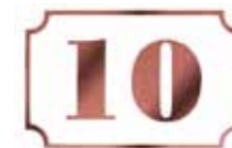
Les noms de rue et numéros de maison pour faciliter la distribution du courrier.

Des panneaux de signalisation indiquant les espaces publics municipaux, les services, les commerces et autres activités seront installés à différents carrefours de la commune et de ses abords. Dans le cadre d'une politique de communication