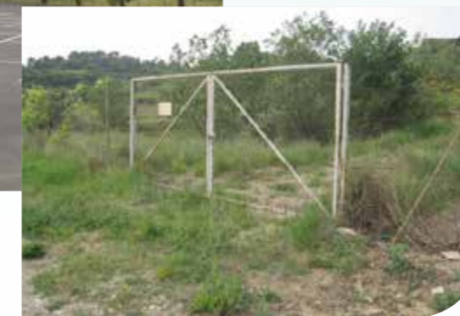
« Réutilisation des anciens bassins de décantation de la cave coopérative »