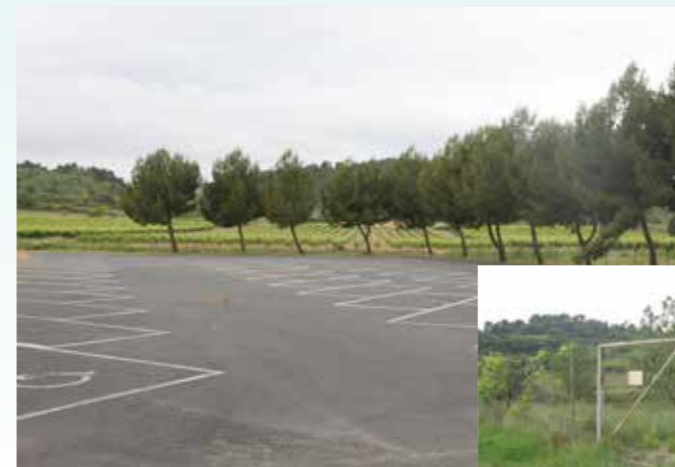
Futur emplacement de la station de lavage

Nous organiserons toutes les réunions nécessaires avec les utilisateurs pour régler les problèmes de fonctionnement et les coûts pour chaque bénéficiaire. Cette réalisation, qui pourrait être achevée en 2016, coûtera autour de 150 000€ hors taxe ce qui laissera à la charge de la commune moins de 50 000€. Cette réalisation se fera sans emprunt, l'autofinancement de la commune étant couvert par les excédents des années précédentes.