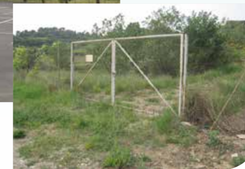
« Réutilisation des anciens bassins de décantation de la cave coopérative »