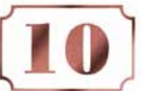
Les noms de rue et numéros de maison pour faciliter la distribution du courrier.

Des panneaux de signalisation indiquant les espaces publics municipaux, les services, les commerces et autres activités seront installés à différents carrefours de la commune et de ses abords. Dans le cadre d'une politique de communication