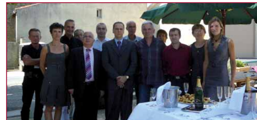
6 juillet 2010 : Le maire et les élus du Conseil recevant le Sous-Préfet, les responsables régionaux d'ERDF, de France Telecom, de SFR/Orange.

"Qu'on en finisse avec ces handicaps qui accablent le village : coupures électriques, central téléphonique obsolète, zone blanche pour les portables. Donnez-nous enfin les mêmes chances que 95% des villages du Languedoc." Tel était l'enjeu de cette réunion au sommet du 6 juillet. Nos partenaires en répondant positivement aux problèmes posés en ont fait un succès.